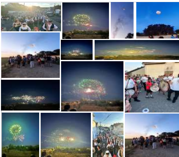
Fête de la Saint Pierre