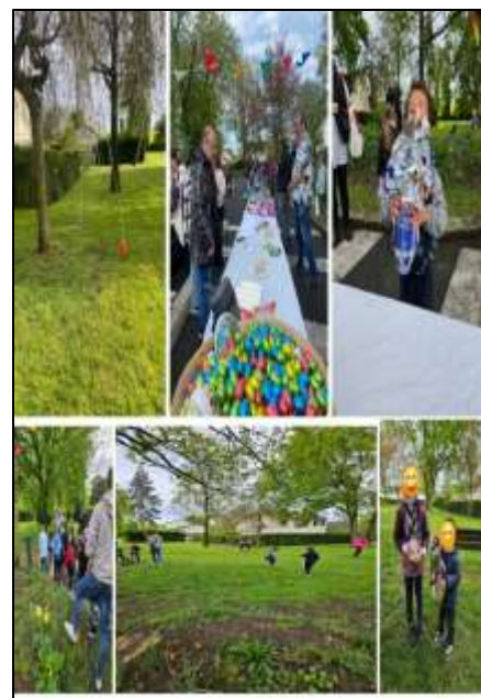
Chasse aux œufs